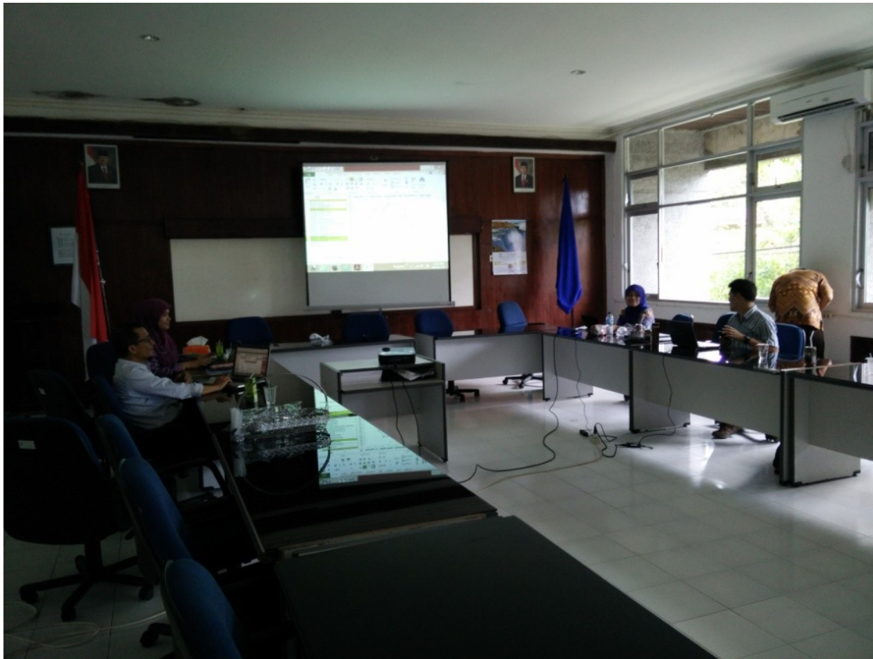
Ketua Tim P' Reflinaldon